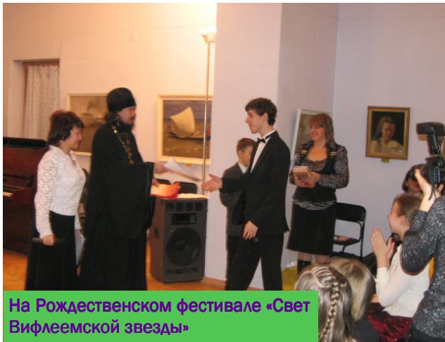
На Рождественском фестивале «Свет Вифлеемской звезды»

Каким был твой путь к музыке? Дума ли ты когда-нибудь, что будешь заниматься ею так серьёзно?