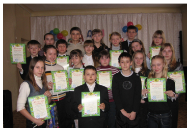
Пояснительная подпись под рисунком