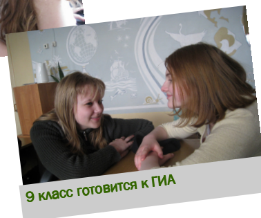
9 класс готовится к ГИА