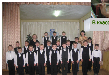
Хор мальчиков МЭЛ