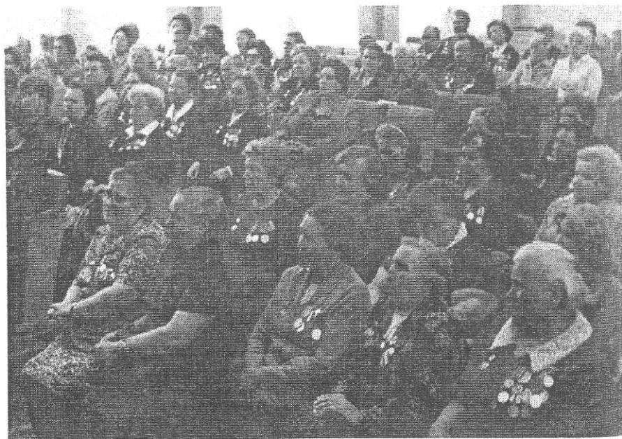
Конференция однополчан 99 ОБ ВНОС на первой встрече Энгельс май 1981 г.